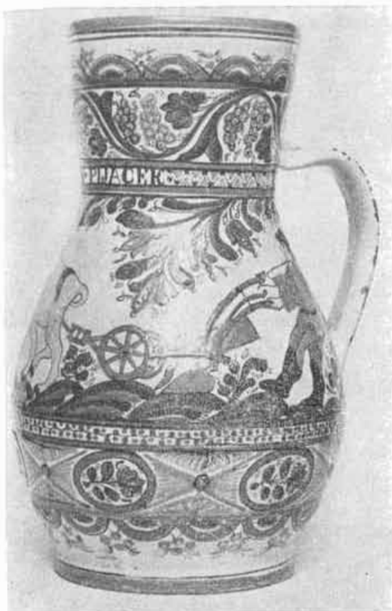
15. Džbán s oráčom z r. 1816, Stupava; SNM Bratislava.