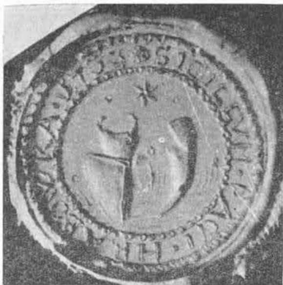
9. Pečaf obce Hrabovka z r. 1733, orig. vo Vlastivednom múzeu v Trenčine.