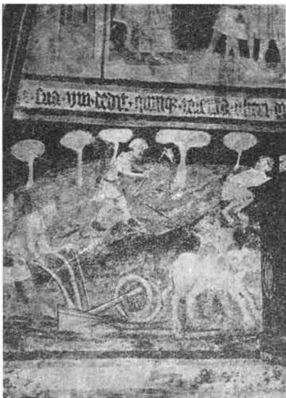
1. Oráč na freske v kostole v Štítniku (1460).

pokiaľ a v ktorých bodoch nám poskytuje konkrétnu pomoc. Je mi pritom jasné, že pri konečnom riešení otázky vývoja orného náradia na Slovensku takéto vyčlenenie nebude možné, ale naopak, bude nutné použiť všetky prístupné doklady.