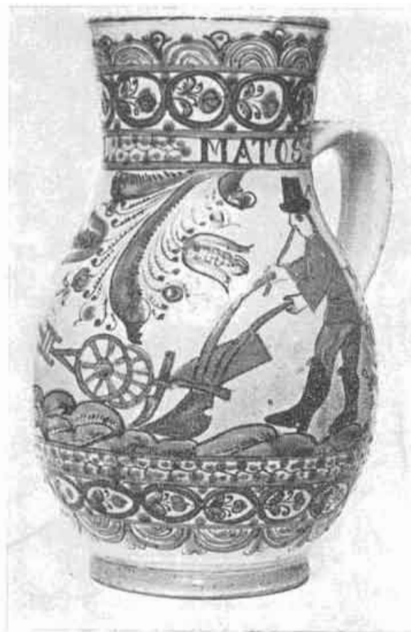
16. Džbán s oráčom, F. Kostka, Stupava; SNM, Bratislava.

(od radla k pluhu), nevieme. Doklad o tom, že sa zmeny v používaní orného náradia odrážali na pečatiach, vidíme na prípade z Dolnej Súče. Jej pečať z r. 1717 má v strede poľa košatý strom a po bokoch asymetrický pravostranný lemeš a čerieslo (obr. 11). Tú istú kompozíciu a tvar pracovných súčiastok má aj druhá nedatovaná pečiatka z tejto obce, ktorú podľa celkového charakteru možno zaradiť do konca 19. storočia (obr. 12), keď sa vôbec začínajú používať pečatidlá v čeloštátnom meradle. 47 Posledná pečiatka je z roku 1937 (obr. 13) a má tiež uprostred košatý strom, na jeho pravej strane je znázornené čerieslo a na ľavej strane namiesto starého lemeša je železná hlava pluhu. 48 Vieme, že poloráželný pluh sa začal tu používať skôr. Pre hodnotenie sfragistického materiálu pre nás je však dôležité zistenie, že aj keď s oneskorením niekoľkých desaťročí, predsa reaguje sa na túto závažnú zmenu. 49 To zväčšuje možnosť jeho