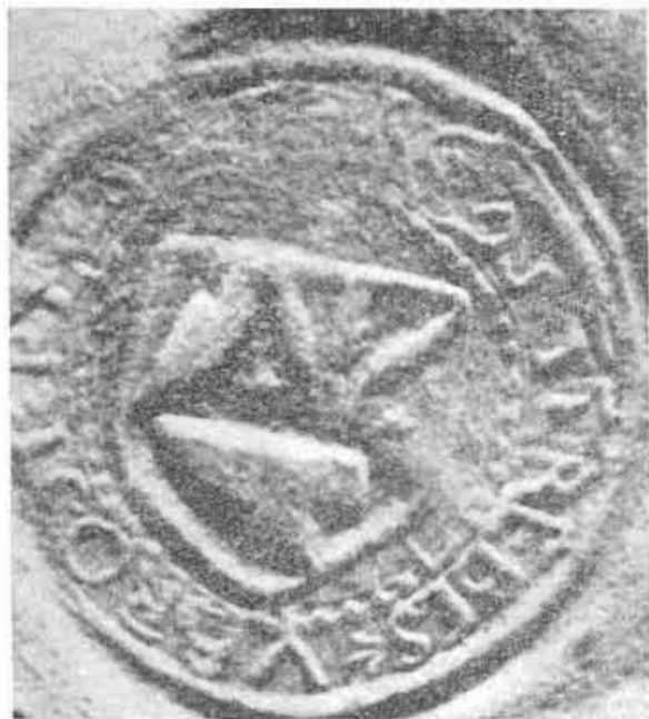
8. Trebišov, pečať z 15. stor. NOVÁK, J.: Slovenské mestské erby a obecné pečate, tab. XV, obr. 6.

S obecnými pečaťami, ktoré sú pre nás najdôležitejšie, 44 môžeme počítať už od samého začiatku 16. storočia. Do týchto čias pri zriedkavých administratívnych vybavovaniach požíčovali mestá svoje pečatidlá obciam, prípadne používali pečatidlo zemepána. Zvýšenou administratívnou činnosťou dostávali obce postupne povolenie vyhotoviť si vlastné pečatidlá. Často je na nich znázornené náradie, typické pre hlavné zamestnanie obce. Z hľadiska našej problematiky je zaujímavý spôsob znázornenia orného náradia, jeho jednotlivých častí a otázka, pokiaľ tento materiál posluží na objasnenie jeho vývoja v jednotlivých obdobiach.