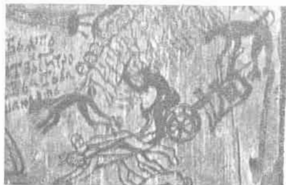
4. Čerti orajúci na hriešnikoch. Nová Sedlica (okolo 1760).

Z východného Slovenska je aj kresba z gr. kat. kostola sv. Michala archanjela z Kožuchoviec 22 z polovice 18. storočia, ktorá znázorňuje údel človeka vyhnaného z raja (Eva pradie, Adam orie), (obr. 3). Na rozdiel od predchádzajúcich dvoch prameňov v tomto prípade je zrejme, že autorom bol ľudový umelec, ktorý svojským spôsobom interpretoval túto scénu, fakticky ako obraz zo svojho života. Inú obsahovú náplň má maľba z prenosného obrazu pravo-