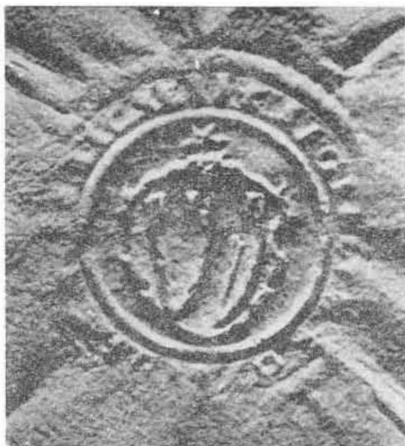
7. Pečať obce Vrblica, 15. stor. NOVÁK, J.: Slovenské mestské erby a obecné pečate, tab. XV, obr. 4.