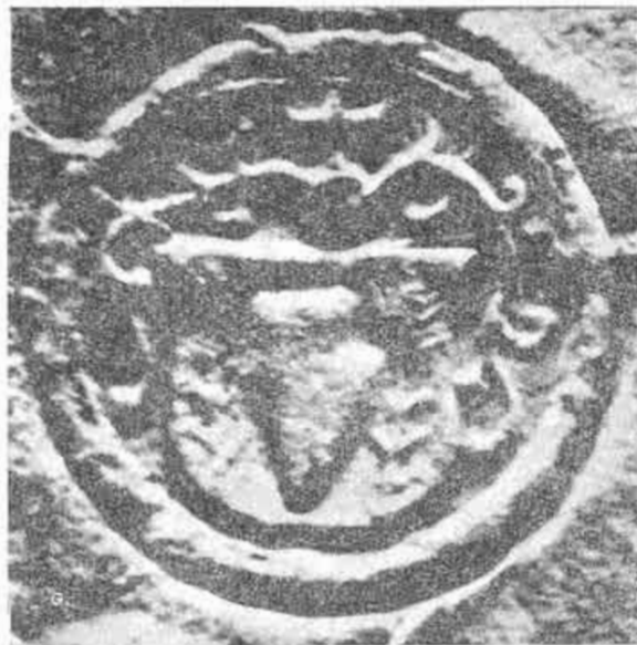
10. Pečaf obce Šaľa, 16. stor. NOVÁK, J.: Slovenské mestské erby a obecné pečate, tab. XV, obr. 5.