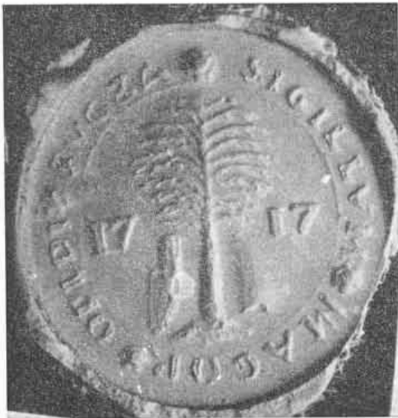
11. Dolná Súča, pečať z r. 1717, orig. vo Vlastivednom múzeu v Trenčíne, Foto J. Novák.