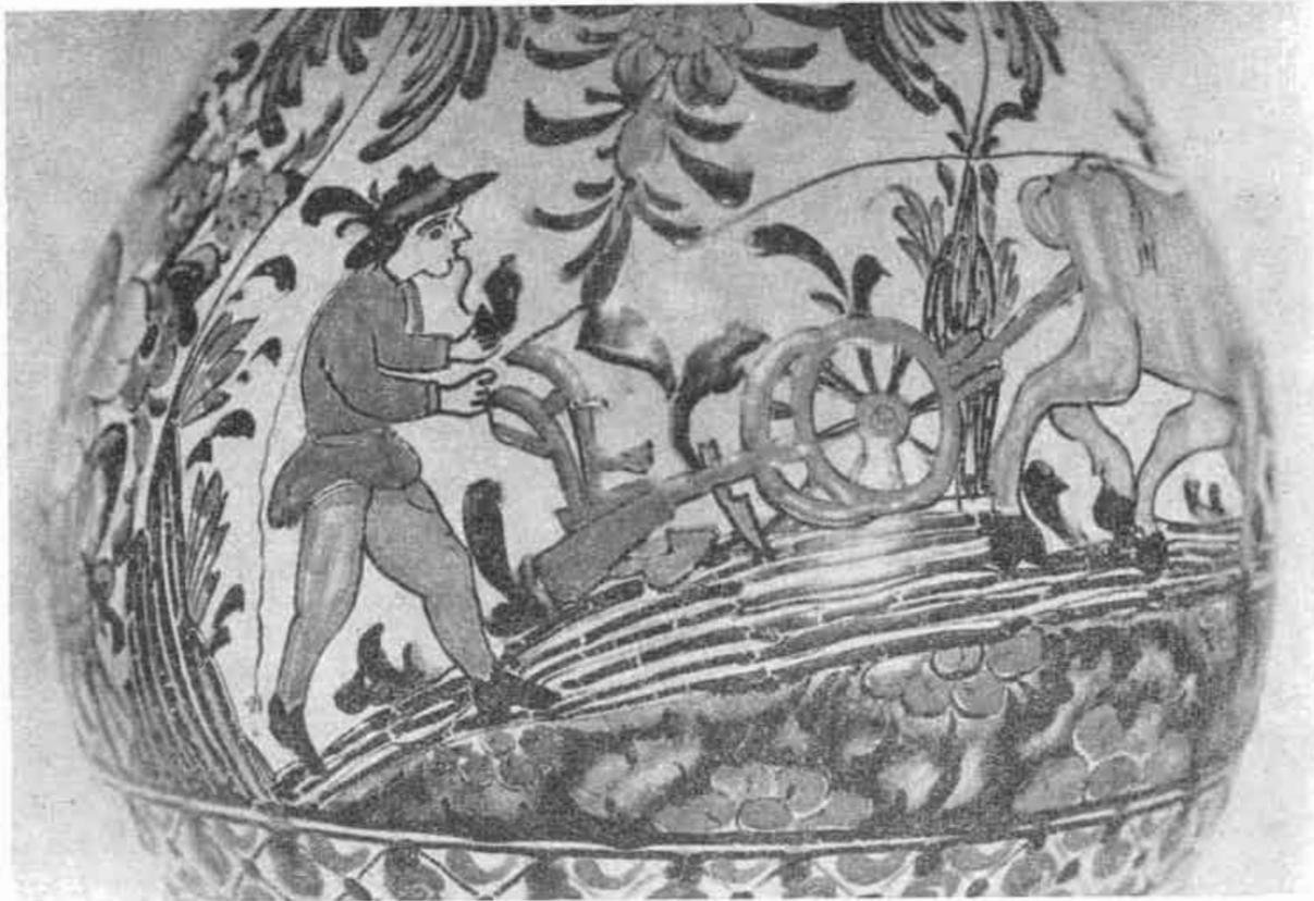
18. Detail džbánu s oráčom, Dechtice; SNM, Martin.

bude snáď možné určiť aj mieru dôležitosti radiel v jednotlivých oblastiach a obdobiach; z hľadiska etnografických poznatkov o význame radiel v jednotlivých častiach Slovenska i z hľadiska už uvedeného ikonografického materiálu z kostolov sú doklady o existencii radiel na pečatiach (symetrický lemeš) neadekvátne zriedkavé. Otázka rytcov a ich vplyvu, objednávateľov pečate a ich predstáv, to všetko bude treba brať do úvahy v konečnom hodnotení. V každom prípade ide o materiál, ktorý si zaslúži systematické spracovanie aj z nášho aspektu a zmapovanie javov podľa jednotlivých období, čím sa aspoň čiastočne vyplní jedna z mnohých medzier, ktoré máme pri sledovaní vývoja orného náradia na Slovensku v predchádzajúcich storočiach.