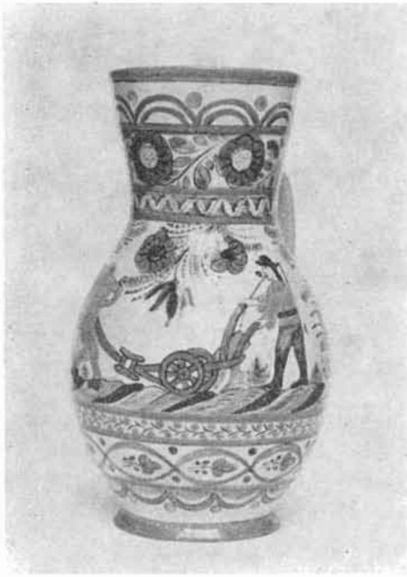
17. Džbán s oráčom z r. 1882, Stupava; SNM, Bratislava.

použitia pri sledovaní niektorých otázok, týkajúcich sa základnej konštrukcie náradia v minulosti.