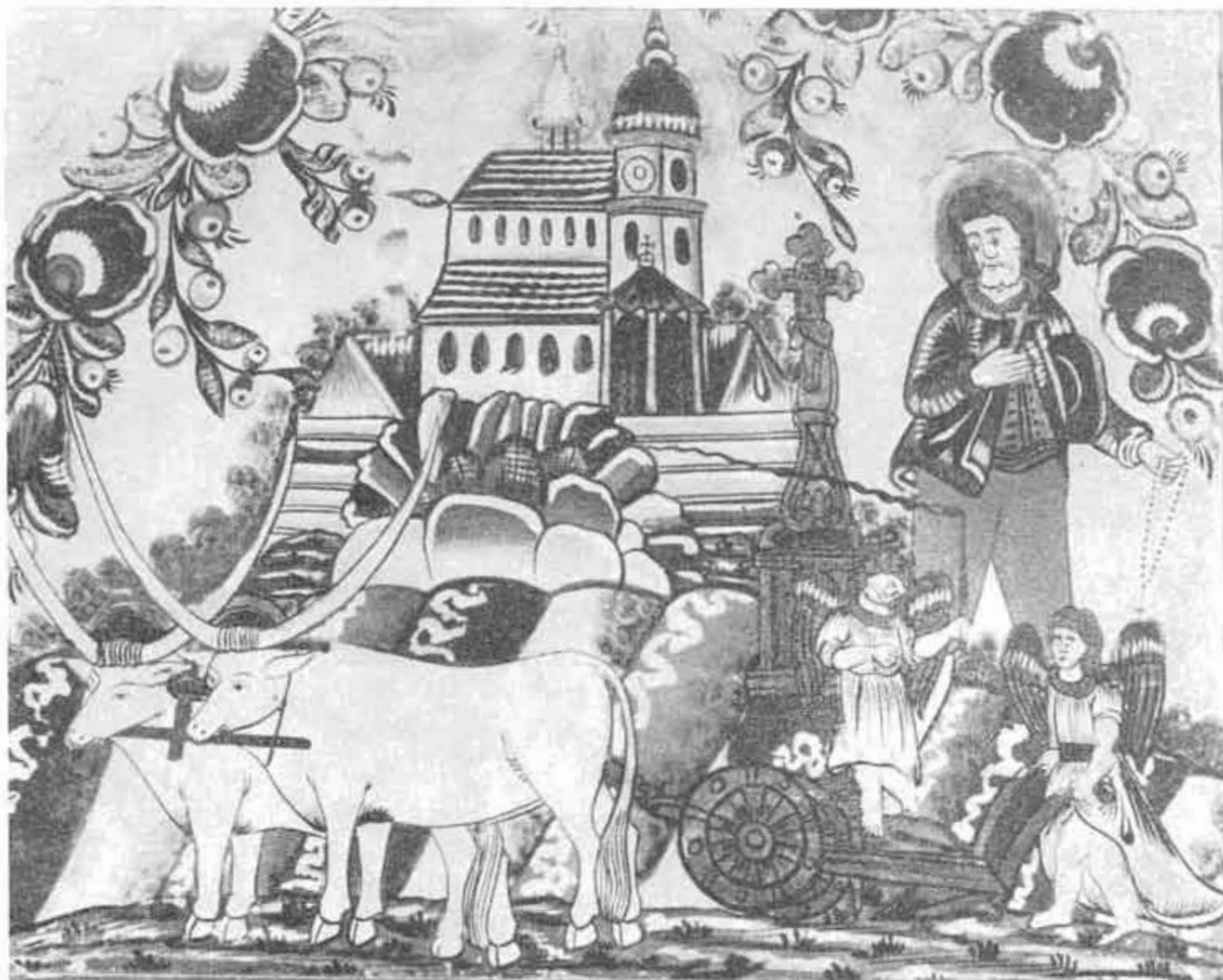
19. Maľba na skle F. Salzmann (polovica 19. stor.); SNM, Bratislava..

Kostku, kresby majú vždy rovnakú kompozíciu a náradie na nich znázornené je okrem menších detailov rovnaké. Rozdiel je len v záprahu. Pluh ťahá jeden pár volov alebo aj kone, zapriahnuté pred voly. Táto variácia bola, zdá sa, ovplyvnená veľkosťou džbánov. Na väčších je dvojjáprah, na menších, kde sa ten nezmestil, je len pár volov, prípadne 1 kôň. Ostatná časť maľby je skoro vždy zhodná. V pravom rohu obrazu stojí oráč s bičom v ruke (obr. 15). Oboma rukami drží dve prienohy pluhu. Okrem prienoh je na ňom znázornený hriadeľ, čerieslo, lemeš a vždy nesprávne umiestnená drevená odvalnica. Jej uloženie nad hriadeľ, ktoré nás často uvádza do pochybností, či ešte vôbec môže ísť o odvalnicu, vzniklo umiestnením oráča do pravého rohu obrazu (obr. 16). Maliar preto videl pluh z ľavej strany, z ktorej odvalnicu kryla čiastočne stĺpica, čiastočne sám hriadeľ. Perspektívne chápanie kresby na keramike je neznáme. Pri plošnej maľbe bolo ťažko umiestniť odvalnicu správne bez toho, aby sa neskomplicovala kresba čeriesla a lemeša. Keď maliar chcel, aby odvalnicu bolo lepšie vidieť, umiestnil ju nad hriadeľ, kde ju kryli len prienohy (obr. 17). Vzhľadom na jej okrové sfarbenie, ktoré je rovnaké s hriadeľom a kolieskami a tiež vzhľadom na to, že železné súčiastky (lemeš, čerieslo, os na kolieskach) sú zväčša far-