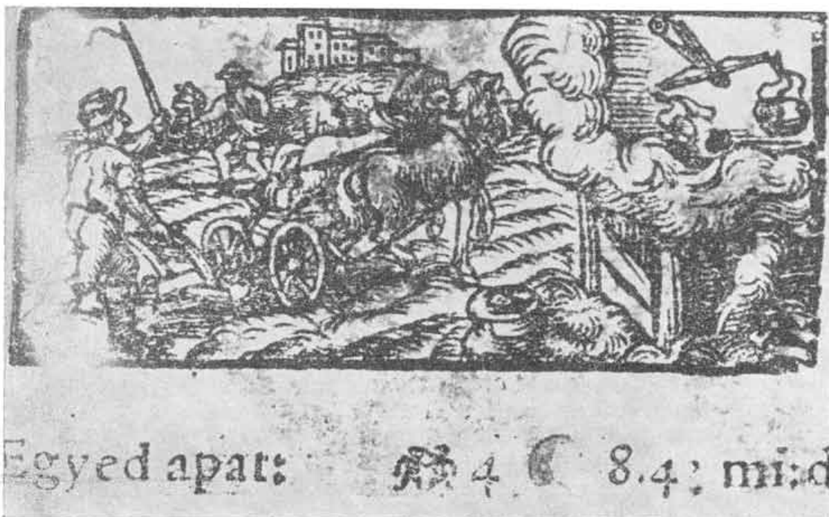
6. Oranie pluhom. Kalendár trnavskej tlačiarne z r. 1589.

ojedinelý ani z teritoriálneho ani z kvantitatívneho hľadiska. Potom však je nepochopiteľné, že sa nám doteraz nepodarilo doložiť podobný typ náradia etnografickým údajom. Uzavrieť definitívne túto otázku nie je možné. Upozorňuje nás však na to, že vierohodnosť ikonografického materiálu i keď je domácej proveniencie, musí byť v každom prípade zvlášť potvrdená aj údajmi iného charakteru, najideálnejšie, prirodzene, údajmi etnografickými a keď tie chýbajú, archeologickými a historickými. Až potom ho môžeme začleniť ako konkrétny doklad o existencii určitého javu na našom území. 33