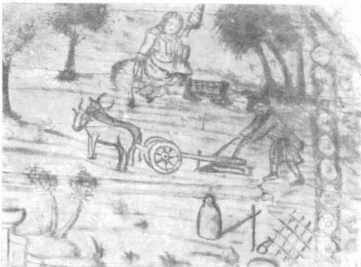
3. Oráč na maľbe v kostole v Kožuchovcia.

Kresba je veľmi poškodená a zo zmätku zlomkov postáv sa akoby zázrakom zachovala najdôležitejšia časť motívu oráča so záprahom. 20 Oráč orie náradím, ktoré má symetrický lemeš, ale na rozdiel od náradia v Štítniku nemá odvalnicu ani čerieslo, a teda ide o radlo. Prienohy sú i tu nakreslené pred seba a spôsob ich upevnenia o pracovnú časť (prípadne či s ňou tvoria jeden celok) a hriadeľ nie je možné s určitosťou rekonštruovať. Cez symetrický lemeš ide páka na regulovanie hĺbky orby, ktorá prechádza cez hriadeľ a má oblúkový tvar. Ide zrejme o bezplazové radlo, ktoré je pre Spiš a s ním susediaci Šariš typické ešte v prvej polovici nášho storočia, i keď už prišlo k zmene jeho funkcie, čiastočne aj konštrukcie a k obmedzeniu oblasti jeho výskytu. 21 Najkoncentrovanejší výskyt bezplazového radla je v období doloženom etnografickým materiálom práve na Spiši, kde sa vyskytuje aj ten istý typ plužných koliesok, aké vidíme na kresbe z počiatku 16. storočia.