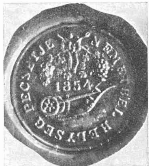
14. Pečať obce Malý Biel z r. 1854, ŠA Bratislava, Foto J. Novák.